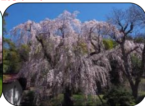
天然記念物・川井家のシダレ桜

・コース：多摩センター駅⇒パルテノン通り⇒多摩中央公園⇒宝野公園⇒桜ロード⇒展望台⇒桜ロード⇒宝野公園⇒そよかぜのみち⇒鶴牧第二公園⇒Y字橋⇒多摩よこやまの道⇒李久保公園(昼食)⇒からきだ百本シダレ⇒お花見広場⇒唐木田駅⇒鶴牧西公園 (解散:14:30頃、約8km) (帰路は、小田急多摩線・唐木田駅から。公園より約5分)