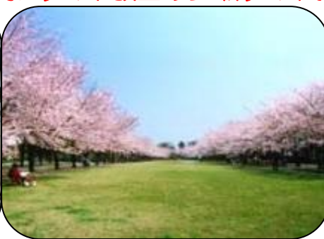
富士見通り(桜ロード)の両脇桜