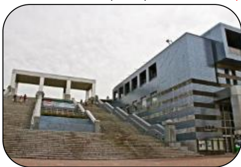
多摩センター駅・パルテノン

②あざみ野(8:16)～武蔵溝の口(8:32)～登戸～新百合が丘～小田急多摩センター着(9:12) ※3月にダイヤ改正あり。新ダイヤ確認下さい。