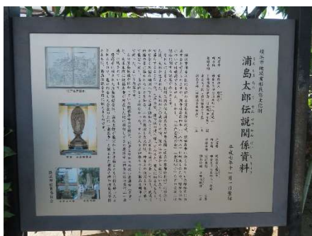
浦島太郎、同寺の説明版