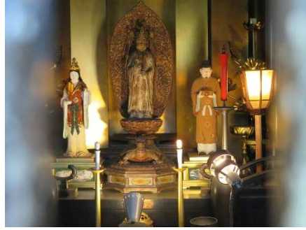
真ん中が竜宮伝来浦島観世音像 右が浦島太郎、左が乙姫