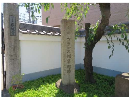
横浜開港時にはフランス領事