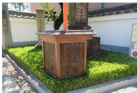
珍しい同寺の案内