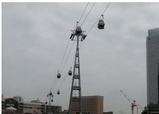
桜木町からのケーブル