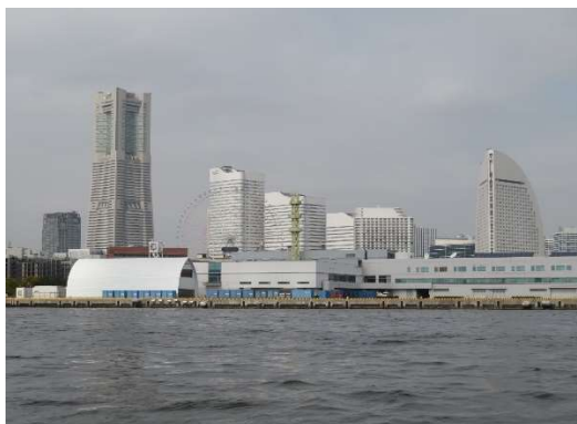
ランドマークタワーなど