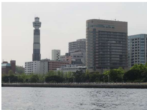
ホテルニューグランド