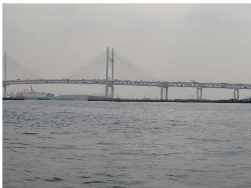
横浜レインボーブリッジ