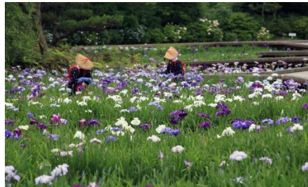
横須賀しょうぶ園