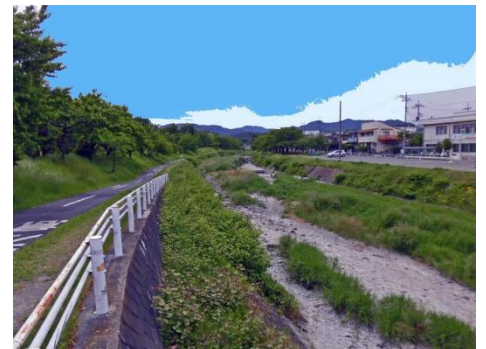
高尾の山並も望める南浅川遊歩道