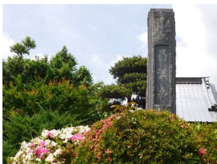
参道入口にはサツキが綺麗

1989 年に題字[福田正夫詩碑]が建立され、井上靖の直筆で『一人のひとが 海ぞひの路をすたすた行く すたすと 何と微妙な晝だ』や達磨の石像、筆塚、梵鐘を鳴らすと遠くまで聞こえるだろうと想像してお参りをしました。