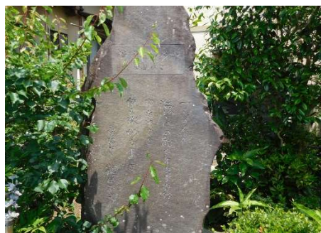
福田正夫の碑(同寺に住み子供に教育)文字が見えなく恐縮です