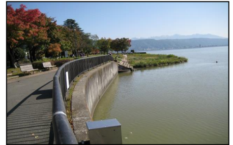
天気がよければ富士山・ハケ岳

★日時：平成 30 年 10 月 23 日(火)～24 日(水)一泊二日 雨天実施