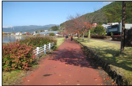
諏訪湖周遊コースは歩き易い